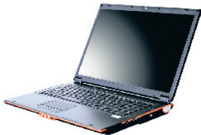
jET M5700RU: PC-Ersatz mit prima Preis-Leistungs-Verhältnis

Fazit: Das jET M5700RU ist ein prima Desktop-Ersatz und bietet ein gutes Preis-Leistungs-Verhältnis. Positiv ist die mitgelieferte Vista-DVD. Abzug gibts für die Abwärme und die Lautstärke.