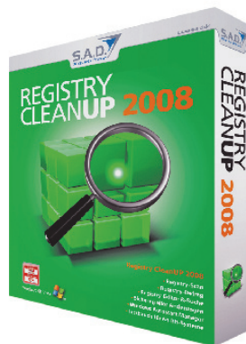
Registry CleanUp 2008: einfach zu bedienen, aber geringer Nutzen

Fazit: Mit Registry CleanUp 2008 optimieren auch unerfahrene Nutzer ihren PC. Die Software ist einfach zu bedienen und lohnt sich vor allem für ältere PCs. Aber selbst dort ist der Nutzen zu gering, als dass sich ein Kauf auszahlen würde.