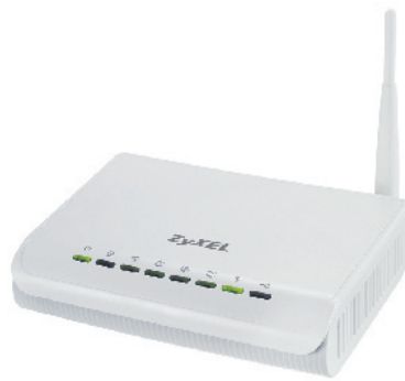
Unkompliziert und sicher: Netzwerk-Router ZyXEL NBG-318S