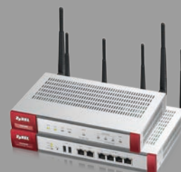
Zyxel USG40W/60W Pare-feu UTM et VPN avec WiFi