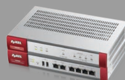
Zyxel USG40/60 Pare-feu UTM et VPN