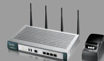
Zyxel UAG4100 & SP350E Passerelle hotspot WiFi avec imprimante à tickets