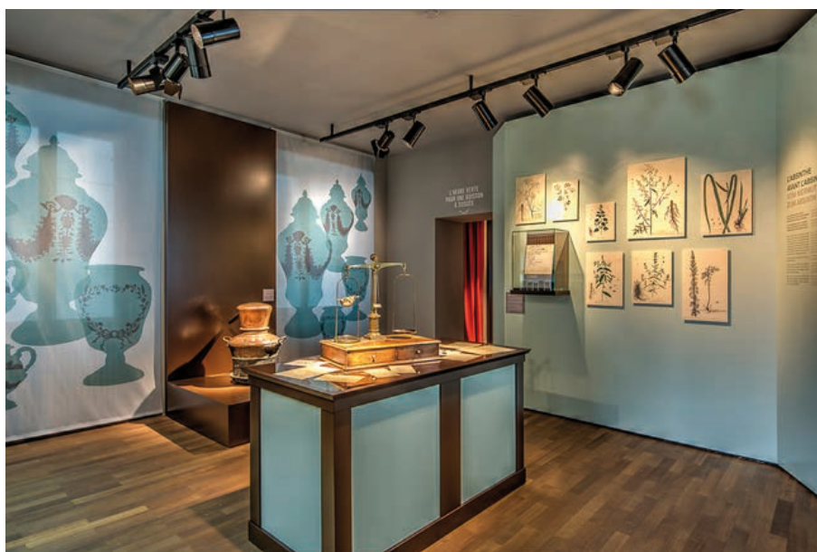
Une découverte des usages et applications de la plante d'absinthe dans la pharmacopée depuis l'Antiquité jusqu'à l'invention de la boisson

VPN connectés à tous les hotspots sont configurés pour le support et la maintenance, a été installé dans le centre de données de Valsys.