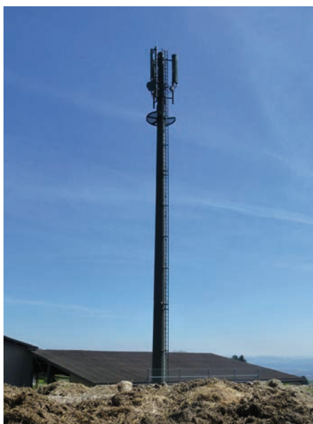
Internet rapide et fiable grâce à un ZyXEL LTE7410

En premier lieu, munis de la carte topographique de la Suisse, nous avons détecté les antennes de téléphonie mobile environnantes. Puis avec la carte de la couverture LTE de Swisscom, nous avons découvert que l'antenne la plus proche du bureau pouvait être une antenne Swisscom. Des premiers tests ont confirmé nos prévisions. Aussi avec la carte topographique, nous avons découvert que le LTE7410, monté sur un côté d'une cheminée hors d'usage, représentait la solution idéale. Nous avons fait passer le câble de raccordement (Ethernet avec PoE+) au bâtiment à travers la cheminée.