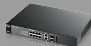
ZyXEL GS2210-8HP Switch Gigabit PoE+ administrable (8x 10/100/1000 PoE, 2x combo pour SFP)