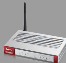
ZyXEL USG40W Pare-feu UTM avec VPN et WiFi