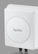
ZyXEL LTE7410 Routeur LTE pour extérieur